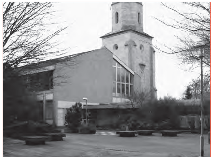
Durch diesen Eingang gingen viele, auch international bekannte, Musiker und Musikerinnen

Stadt und die Öffentlichkeit hat 800.000€ (oder vielleicht noch mehr?) für den Abriss bezahlt. Ein Hotelinvestor ist nicht in Sicht, Braunschweig braucht ein solches Hotel nach Ansicht der Hotelbranche auch überhaupt nicht. Und nun? Wir werden weiterhin das soziokulturelle Zentrum fordern, denn es gehört dorthin. Und es wäre durchaus mit einem Haus der Kulturen kombinierbar, das Braunschweig ebenso dringend zentral gelegen benötigt. Aber wundern darf man sich nicht, wenn die Mehrheitsfraktionen von CDU und FDP das Gelände, sollte sich das Luxushotel nicht realisieren lassen, letztlich für Wohnbebauung