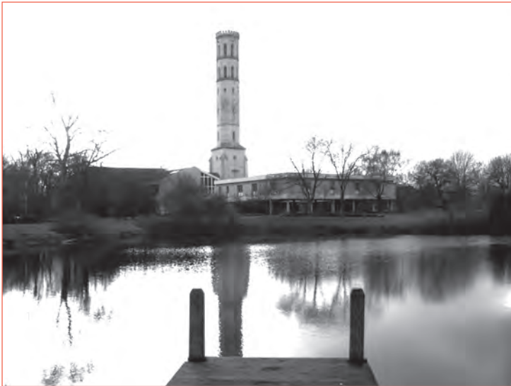
Das FBZ - wie es einmal war

Mancher jüngerer Braunschweiger sich vielleicht schon gar nicht mehr an das Freizeit- und Bildungszentrum im Bürgerpark. Dennoch macht sich sein Fehlen für viele Gruppen nach wie vor bemerkbar.